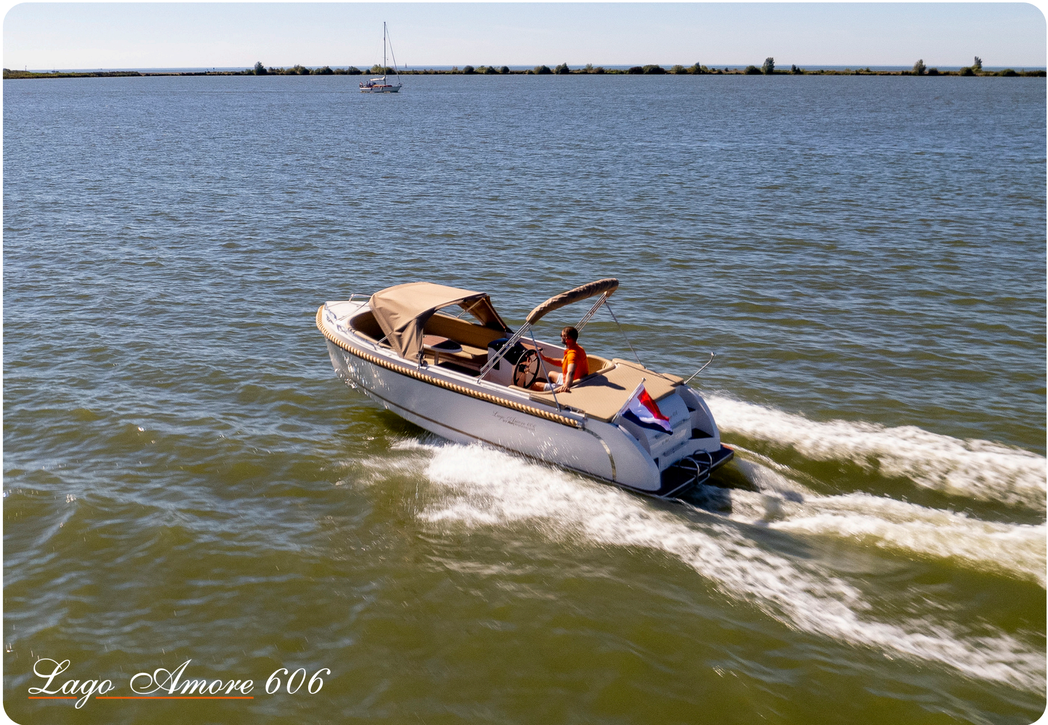
Lago Amore 606